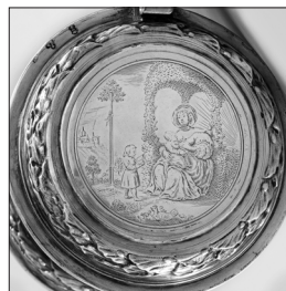
il. 38 s. 284

Autorstwo kufła potwierdzają znaki imienne złotnika, bite w trójlściu z inicjałami P/HL 6 (znak dwukrotnie bity na korpusie i pokrywie naczynia obok chwytu) oraz towarzyszące im znaki miejskie Gdańska z lat 1659–1674 7 . O prawdopodobnych wędrówkach tego obiektu świadczy cecha importowa, w tym przypadku – francuska z lat 1838–1864, z przedstawieniem chrząszcza w poziomym prostokącie 8 (il.39).